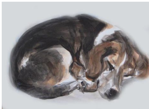
Примеры детских работ.