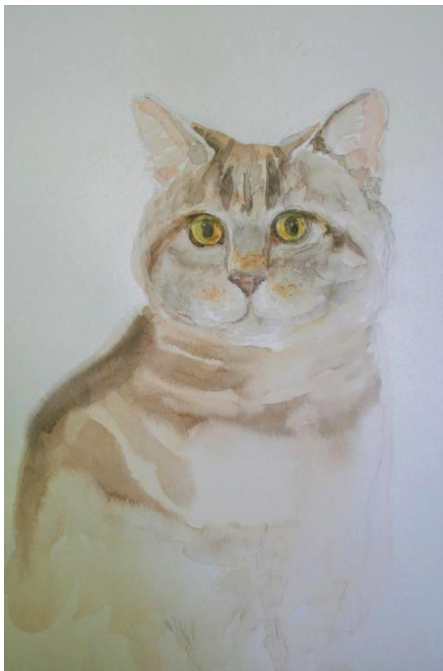
Образец акварельного наброска, выполненный преподавателем Зверевой Т.А.