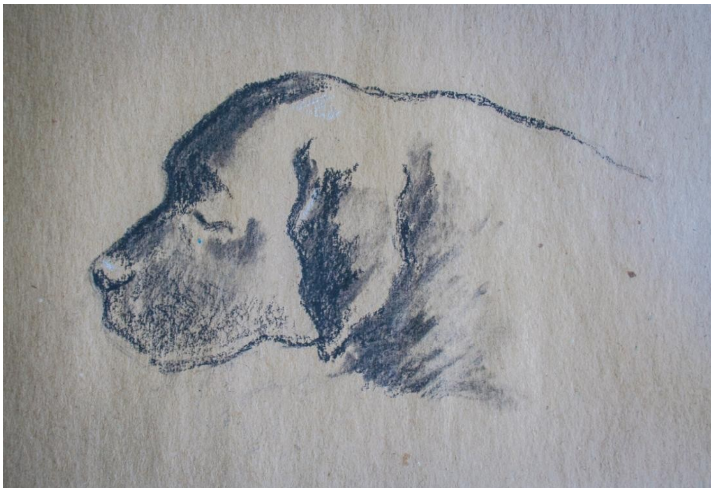
Рисунок с натуры