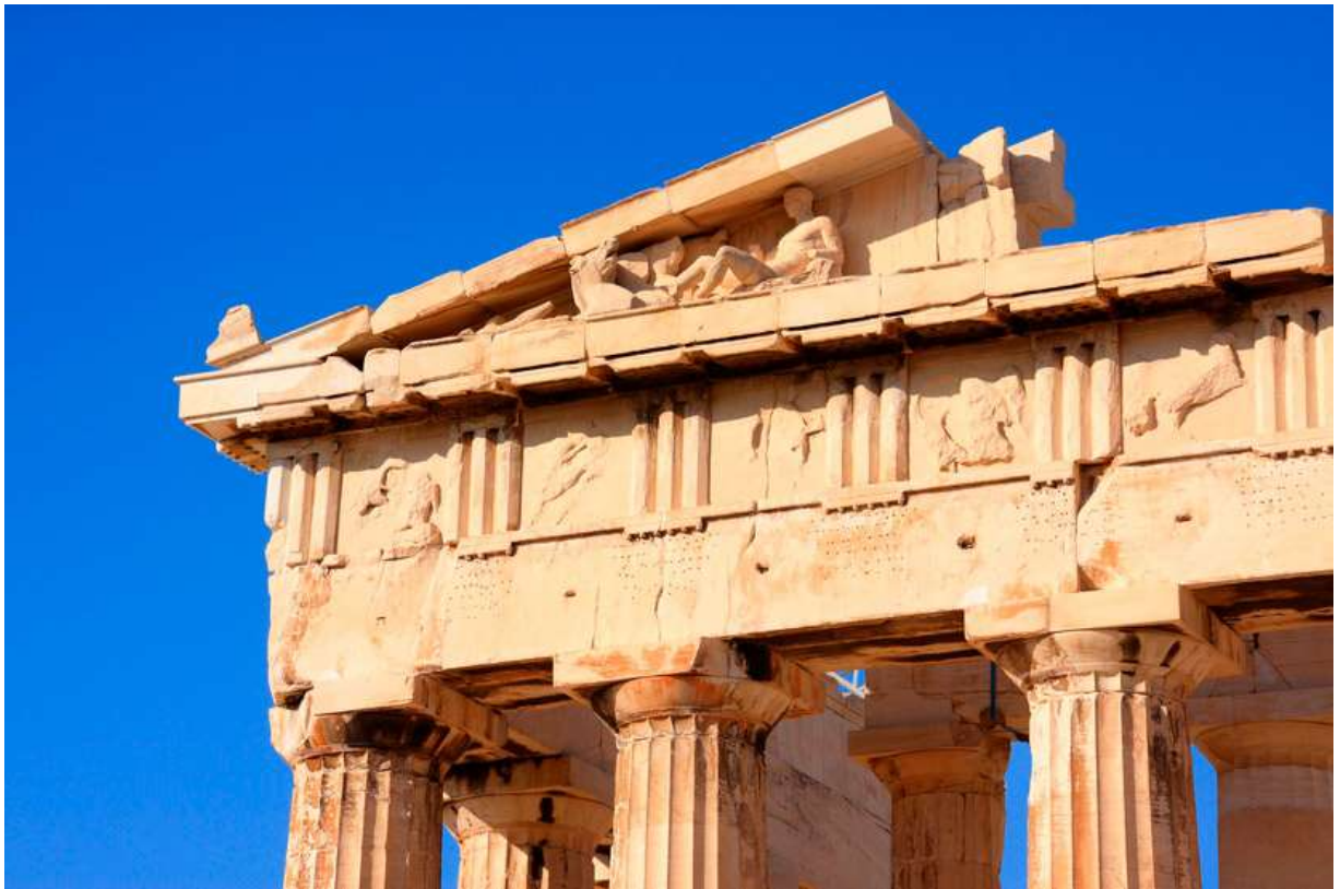
Рис.9 Фрагмент восточного фасада храма Парфенон