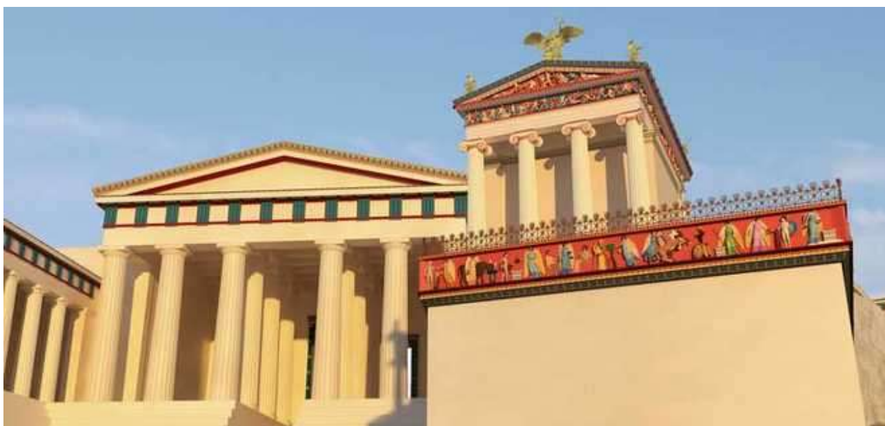
Рис. 5 Реконструкция Акрополя. Храм Ники (справа)