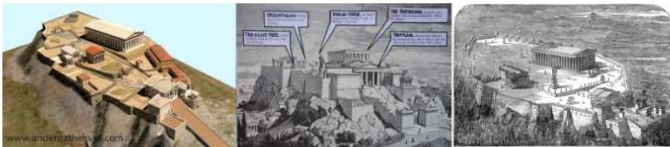
Рис. 3 Реконструкции афинского Акрополя