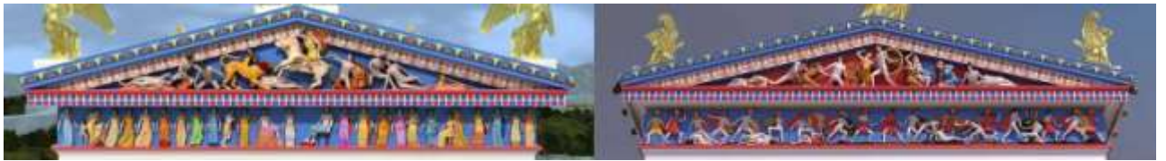
Рис.6 Реконструкция фриза храма Ники