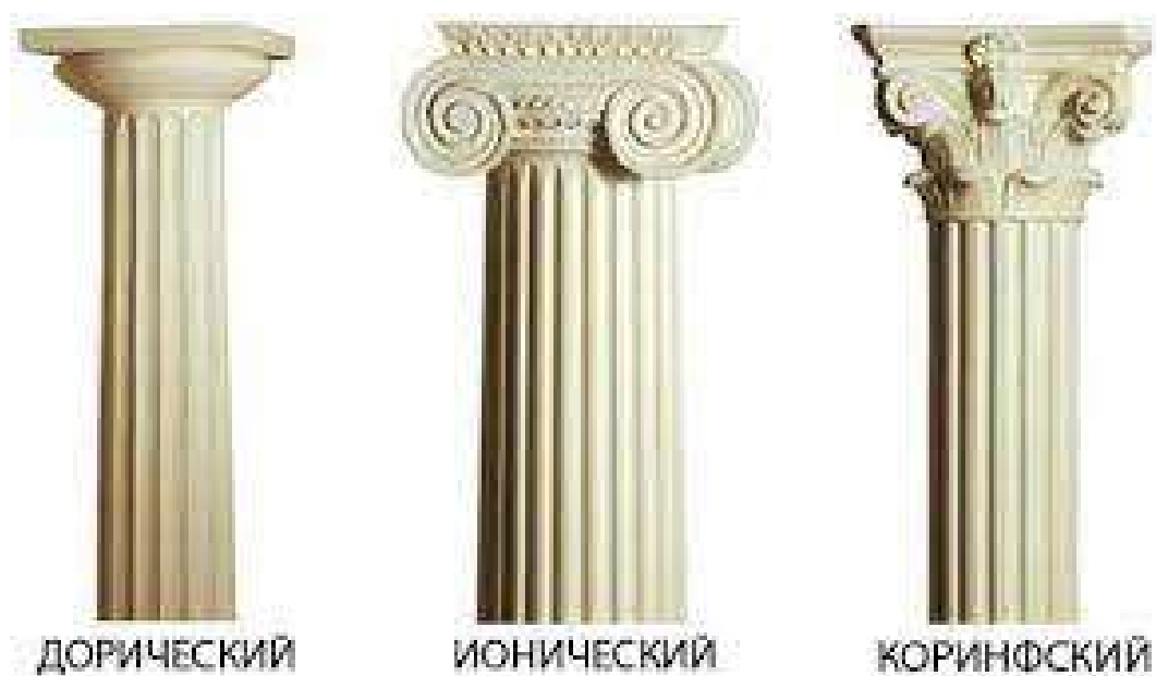
Рис.1 Колонны, оформленные в разных стилях