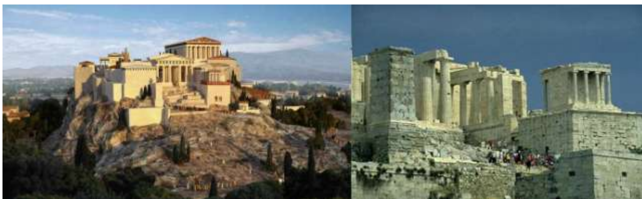
Рис. 4 Афинский Акрополь